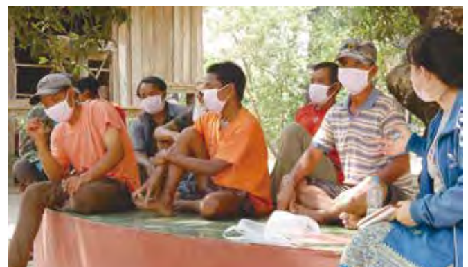
マスク着用で行われた村での研修