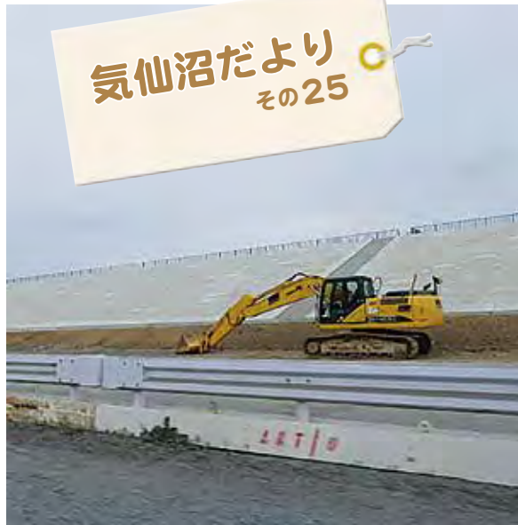
防潮堤の工事はつづく(2020年9月)

気仙沼高校跡が東日本大震災遺構・伝承館となり、学生たち が修学旅行で訪れていました。また道路を挟んだ向かい側は お子様たちが簡単にゴルフを楽しめる場所になり、その先は海 が全く見えない高い防潮堤が続いていました。今回の訪問で、