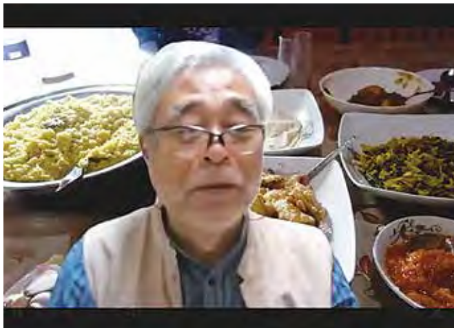
地球の木講座 Zoom画面から