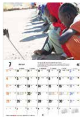
写真 堀潤 氏