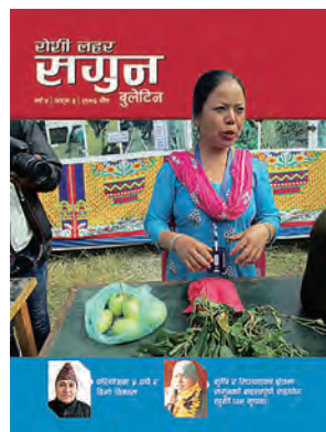
『ロシラハール』最新号